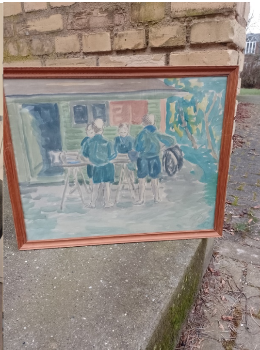
Spejdere fra Hjortshøj