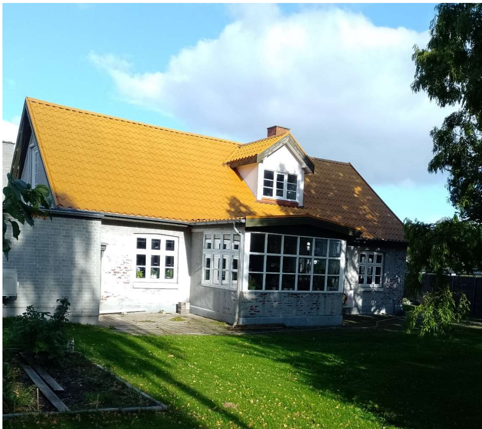
Stuehus tidligere Egå Møllevej 46, i dag 2024 er adressen Vorrevangs Alle 23 Skæring